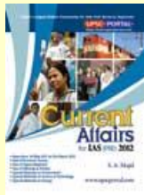
Current Affairs 2012 Medium: English