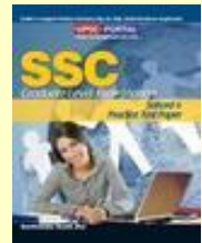
SSC: Solved And Practice Test Paper (Graduate Level Examination) Medium: English

Click Here For Book : http://sscportal.in/community/books