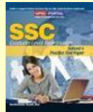
SSC: Solved And Practice Test Paper (Graduate Level Examination) Medium: English

Click Here For Book : http://sscportal.in/community/books