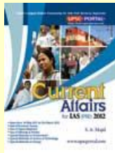
Current Affairs 2012 Medium: English