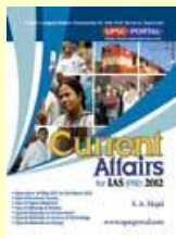
Current Affairs 2012 Medium: English