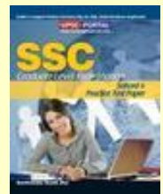
SSC: Solved And Practice Test Paper (Graduate Level Examination) Medium: English

Click Here For Book : http://sscportal.in/community/books